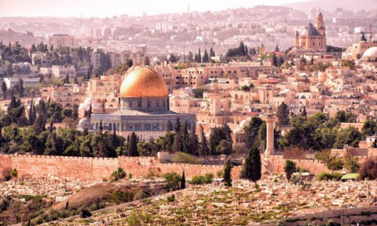
Blick vom Ölberg, Jerusalem

Am späten Nachmittag geht es für uns ans Tote Meer für ein schwereloses Bad im warmen Salzwasser. Der See liegt 417 m unter dem Meeresspiegel; seine Ufer sind damit die tiefsten natürlichen Landflächen der Welt. Der hohe Mineraliengehalt birgt heilende Wirkung auf Hautschäden; dabei kommen unter anderem Magnesium, Kalzium und Bromid zum Einsatz – wohltuend für verspannte Muskeln, empfindliche Haut und sonstige Wehwehchen!